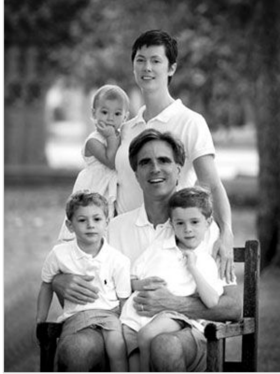
ராண்டி பாஷ் - குடும்பத்துடன்

- ராண்டி பாஷ் [Randy Pausch] (ஆகஸ்ட் 27, 2007).