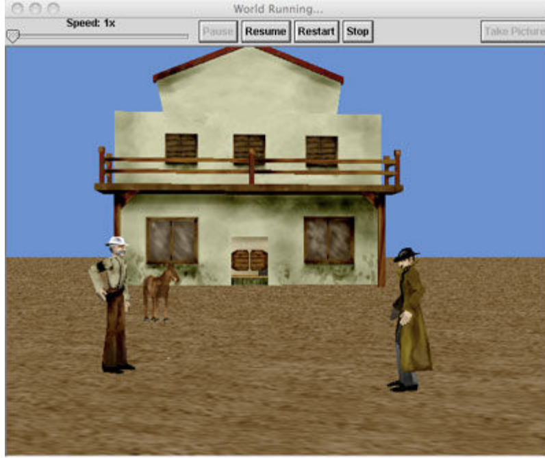
படம் 2 : நான் “எழுதிய” நிரல் - காட்சிக்கோப்பாக

பத்து சதவிகித அமெரிக்க பள்ளிகள் ஆலிஸ் மூலம் கணினி நிரலாக்கத்தினை கற்றுத்தருவதாக ஒரு புள்ளி விவரம் சொல்கிறார்கள். இந்தியாவிலும் இந்த நிரலினை பயன்படுத்தி கற்றுக்கொடுத்தால் நிச்சயம் பலன் தரும் என்றே தோன்றுகிறது.